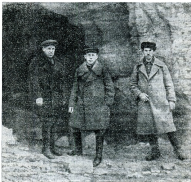
Вход в катакомбы у села Нерубайское

ские отряды в 1918 году выступили против войск националистической Центральной рады, а потом австро-германских и англо-французских захватчиков.