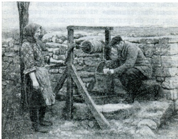
Колодец в селе Нерубайское, через который партизаны поддерживали связь со своими разведчиками

Одессой соединения 4-й армии в Бессарабию и Румынию для переформирования и пополнения. Надо было затормозить этот процесс, добиться, чтобы 4-я армия как можно дольше не появлялась на фронте.